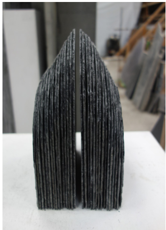
Ardoises, sculpture, Anne-Marie KLENES