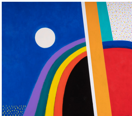
Simplifiez-vous la vie, de Willoos