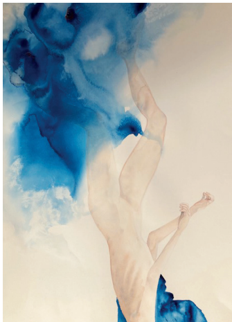
2021 la chute, Fabienne Damoiseaux