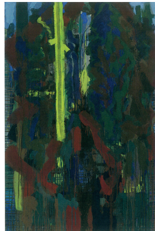
Le sapin rouge, Jean-Pierre Ransonnet, huile sur toile